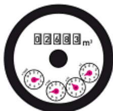
Contatore a lettura diretta

La rilevazione dei consumi è di minimo 2 tentativi per consumi medi annui fino a 3000 mc, mentre per consumi medi annui superiori a 3000 mc è di minimo 3 tentativi