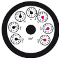
Contatore a lancette

La lettura si esegue leggendo le cifre Da sinistra verso destra