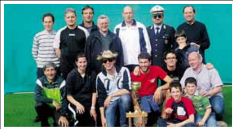
Sopra la squadra vincitrice di Leffe; in basso momento della gara di tiro con l'arco

Nelle prove si sono cimentati genitori e ragazzi, ma anche i sacerdoti provetti arcieri per un giorno