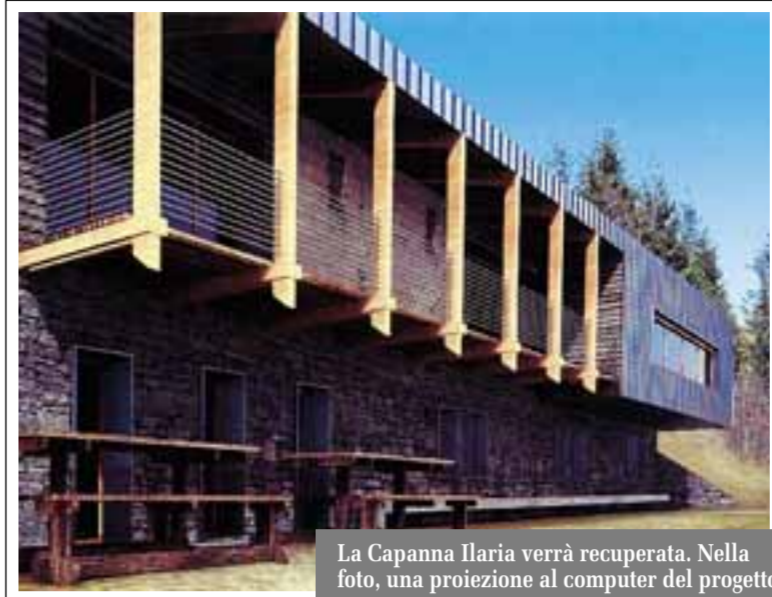
La Capanna Ilaria verrà recuperata. Nella foto, una proiezione al computer del progetto

Tornerà ad essere rifugio alpino, previsti tre anni di lavori. Spesa di un milione. Il Cai: grazie a chi ci darà una mano