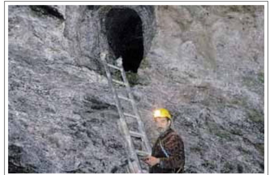
Sopra, l'antico cunicolo della miniera. Sotto, il lume ritrovato